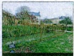
BALADE. Sur la sente des outils (osiers en berrichon).

Une balade nature complète le circuit Zulma Carraud. Sur le chemin longeant la petite rivière Verger, on découvre trois lavoirs restaurés et plusieurs variétés d'osier, dont une torsadée, en clin d'œil au clocher tors ! ■